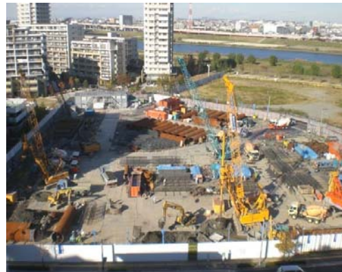
場所打ちコンクリート杭工事